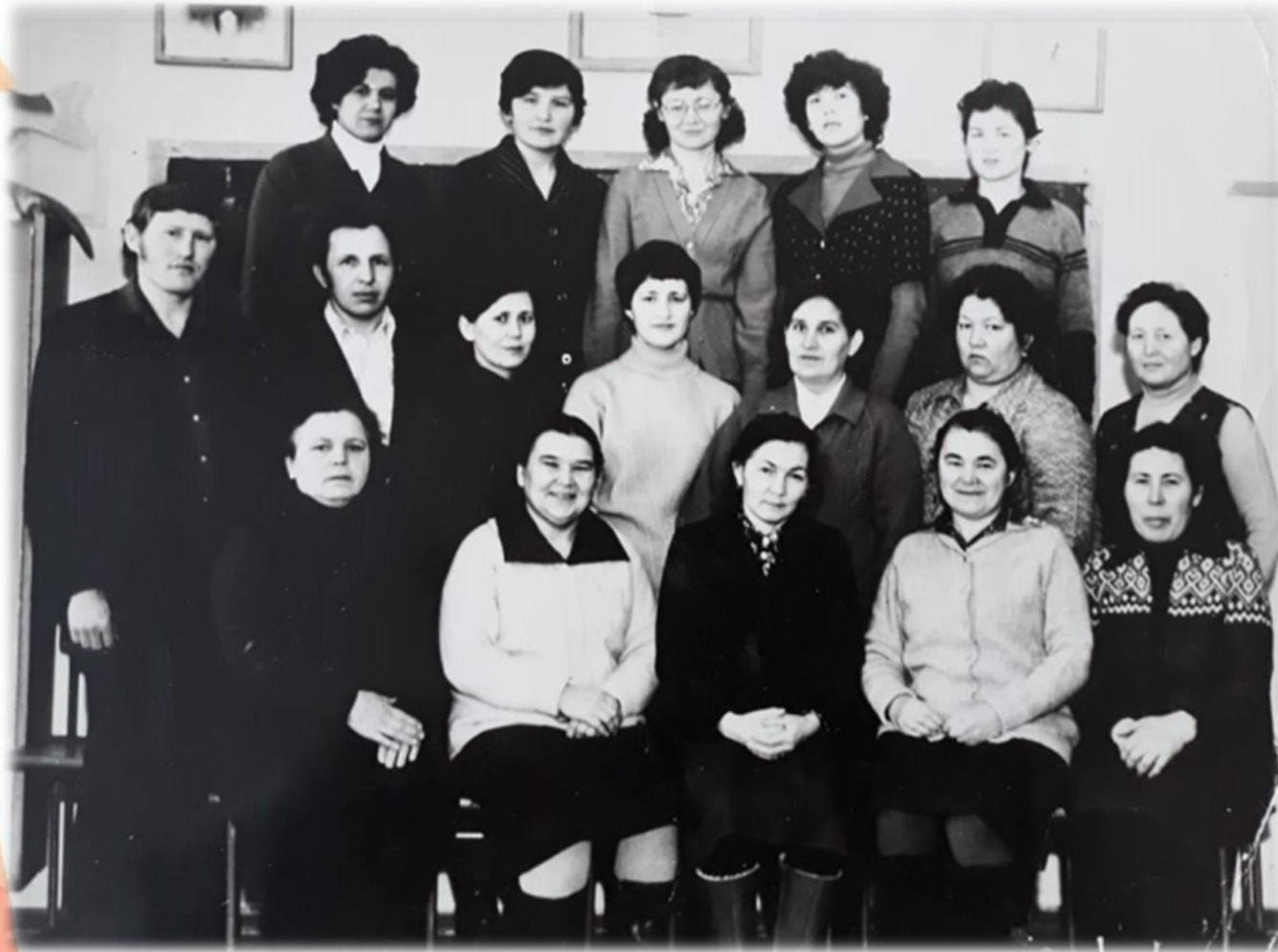
Коллектив учителей Каранской средней школы. 1982г.