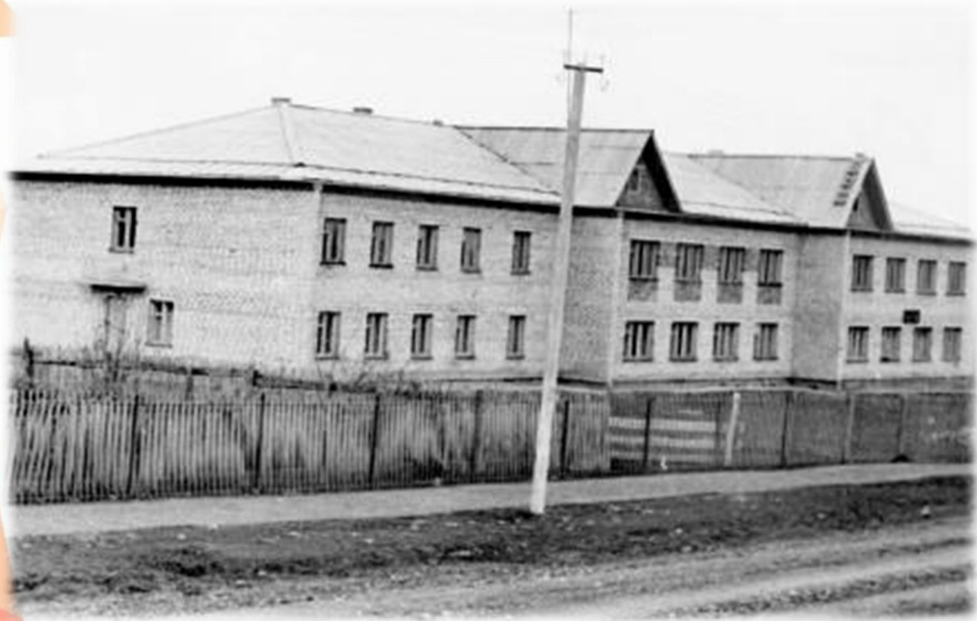
Строительство школьного интерната. 1979 г.